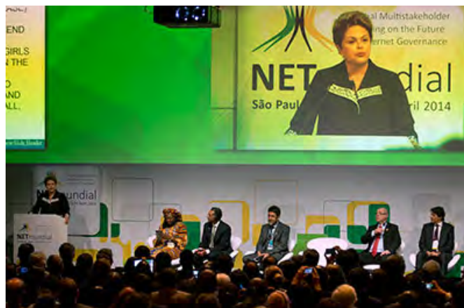
A presidente do Brasil, Dilma Rousseff, fala em um fórum de Internet em 23 de abril de 2014 depois de um projeto de lei que garante a privacidade na Internet e o acesso à Web ter sido aprovado pelo Congresso.

Entre as melhorias possibilitadas por essa abordagem estava uma modificação fundamental para um dispositivo inicial que teria imposto responsabilidades aos hospedeiros de websites pelo conteúdo dos seus usuários, caso deixassem de censurar imediatamente o material após denúncia de terceiros sobre conteúdo difamatório ou de outra forma censurável. Como CPJ destacou na época, o dispositivo poderia levar a uma censura generalizada por empresas de Internet. Depois que o CPJ e muitos outros se opuseram ao dispositivo, foi adicionada ao projeto a exigência de uma ordem judicial para remover conteúdo.