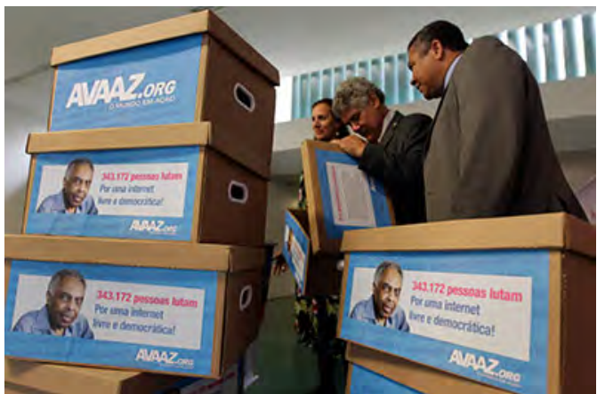
Congressistas brasileiros abrem caixas de assinaturas em apoio ao Marco Civil da Internet.

Embora o projeto de lei tenha sido depois alterado para incluir concessões que o ajudariam a seguir em frente, continuou em grande parte intacto. Durante todo esse tempo, a sociedade civil pressionava pela Carta de Direitos na Internet . Entre as vozes que defendiam o Marco Civil estava a de Berners-Lee. Em entrevista coletiva em maio de 2013, no Rio de Janeiro, ele declarou : "Este projeto de lei preserva a Internet como ela deveria ser: uma rede aberta e descentralizada, em que os usuários são a máquina para a colaboração e inovação."