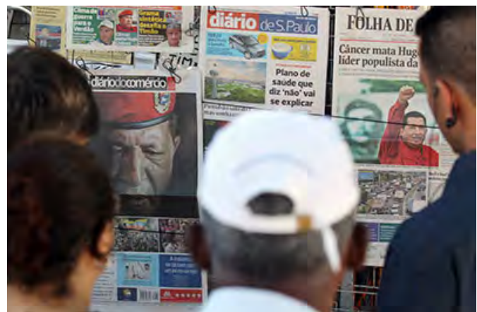
Os alvos da censura judicial vão de grandes jornais metropolitanos, na foto, a empresas de internet e blogueiros independentes.

Por exemplo, o artigo 17 do Código Civil proíbe a divulgação de informações pessoais que possam "prejudicar a honra" de um indivíduo. Ao contrário dos Estados Unidos, onde a Suprema Corte determinou que as autoridades públicas têm o elevado ônus da prova nos casos de alegada difamação ou calúnia, o Judiciário do Brasil não estabeleceu tal norma. Como resultado, os políticos no Brasil têm aproveitado os artigos de privacidade para refrear a liberdade de expressão.