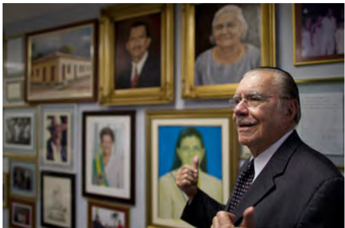
O ex-presidente brasileiro José Sarney tem travado uma batalha judicial contra o jornal O Estado de São Paulo.

Em alguns casos, outros meios de comunicação foram autorizados a informar sobre temas proibidos em outras regiões do país, como ocorreu nos casos de Sarney e do Diário de Pernambuco . Mas a possibilidade de ser penalizado com uma multa ou ordem de silenciamento é muitas vezes suficiente para manter outros meios de comunicação calados.