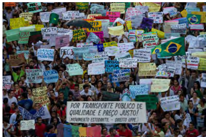
Millhares de manifestantes protestam em junho de 2013 contra os gastos do governo com a Copa do Mundo, em vez de com serviços públicos.