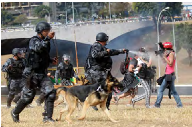
Um policial aponta spray de pimenta para fotógrafos durante um protesto em setembro de 2013.

A ABRAJI documentou 163 violações contra a liberdade de imprensa envolvendo 152 jornalistas entre maio de 2013 e final de março de 2014. Em mais de 100 casos, os repórteres disseram que foram deliberadamente atacados depois de se identificarem como membros da imprensa. Agentes da lei foram responsáveis por mais de 80 desses abusos deliberados, enquanto manifestantes responderam por 22 deles.