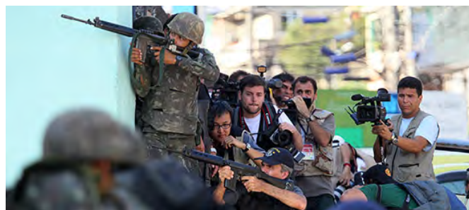
A polícia, soldados e jornalistas tomam posição durante operação em uma favela na capital em novembro de 2010.

Em grandes capitais e regiões metropolitanas está mais consolidado o respeito à mídia, aos jornalistas e à liberdade de expressão. Já em localidades mais remotas do interior isso nem sempre é verdade. O Brasil tem cerca de 5.500 cidades, metade delas muito pequenas. Nesses municípios, é comum o líder político ser também o dono dos principais meios de comunicação.